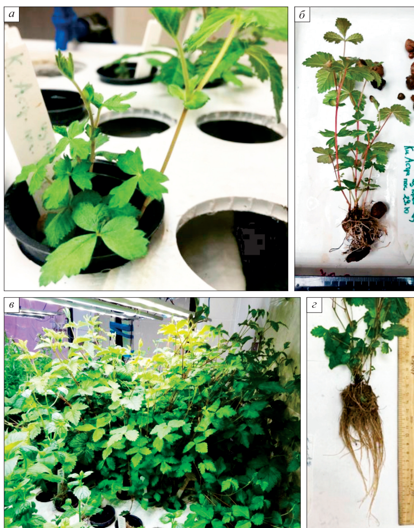
Рис. 2. Растения княженики арктической сорта Astra после высадки на адаптацию.

а – на 38-е сутки; б – на 45-е сутки; в , г – на 60-е сутки культивирования